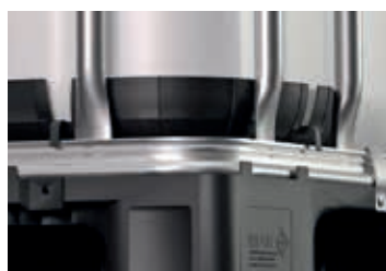
Chránič rohů Dodatečná ochrana vnitřní nádoby proti náhodnému zasunutí vidlí.