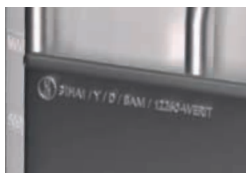
UN ražba UN 31 HA1/Y/D/BAM